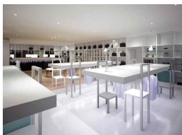
<그림 1> Nendo (Japan)

형태의 비정형성은 공간에서의 비일상적인 분위기를 자아내고 '액자 속 액자'와 같은 프레임 안에 또 다른 공간을 연출시켜 연속성의 효과를 나타낸다. 즉, 형태와 스케일을 왜곡시켜 이질적인 재료를 중첩, 병치 시킨다. <그림 3>은 벽면에 설치한 형색만 갖춘 문을 살짝 개방하여 안과 밖을 명쾌하게 구분 짓지 않는 모호한 분위기를 연출시켰다.