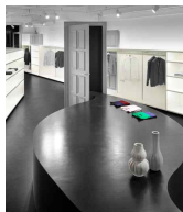
<그림 3> Nendo (Japan)