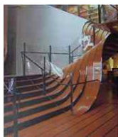
<그림 2> Heatherwick studio 'Longchamp Store'