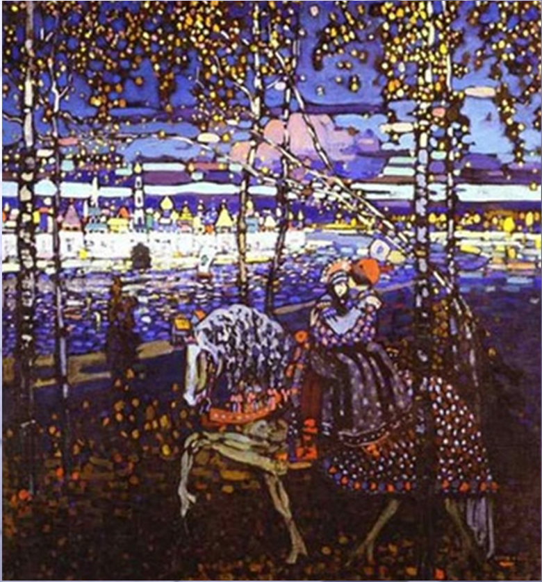
<마음 타 여이>

1911년 harar의 회화의 모티브이다. 카디스키의 회화의 느낌과 어울리며, 모티브에서 느껴지는 선, 선, 면의 조화가 차례차례 더욱 아름답게 한다.