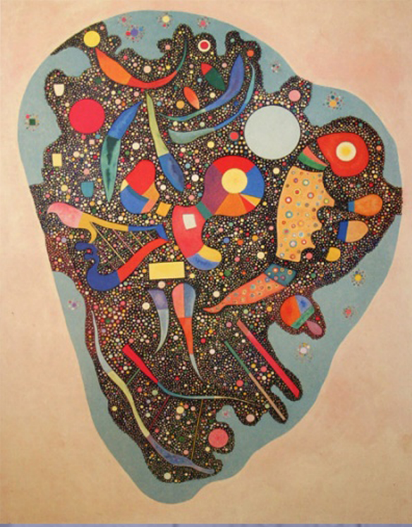
<색이 풍부한 총체>