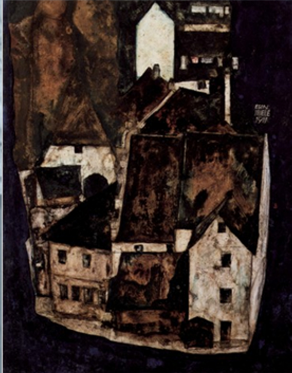
<죽은 도시 또는 푸른 강변의 도시>